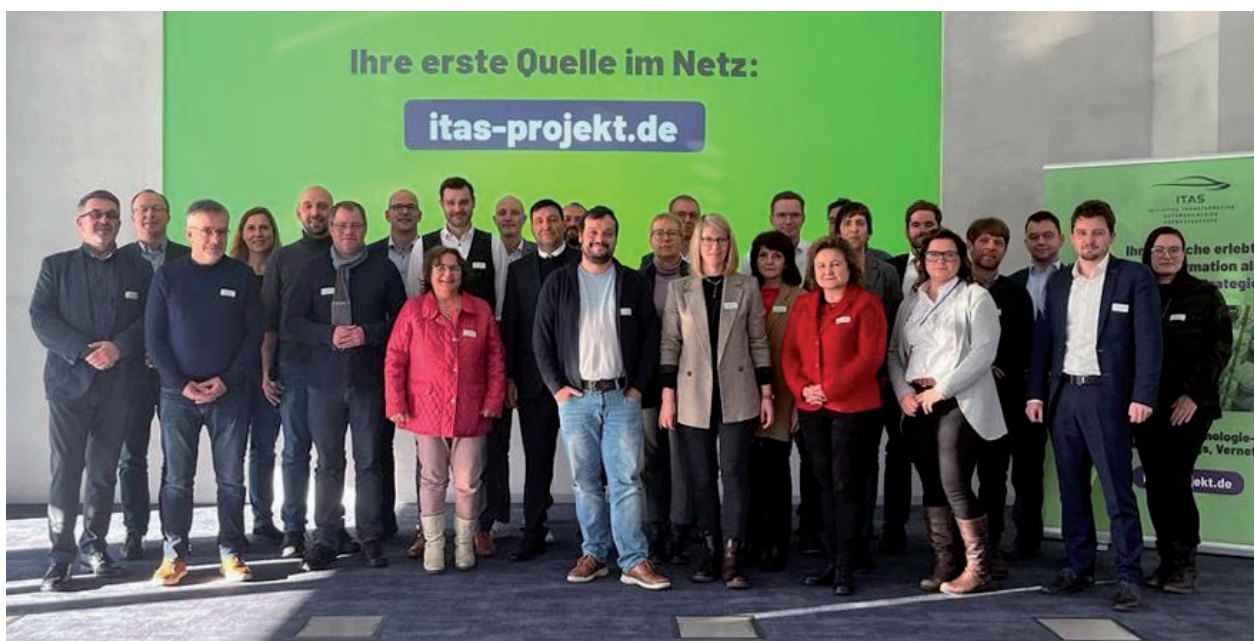
Treffen des erweiterten ITAS-Steuer- und Lenkungskreises am 13. Dezember 2022.

In allen Transformationsnetzwerken werden auch strategische Themen , wie bspw. Fragen regionaler Wertschöpfungsketten und Fragen der Rohstoffsicherung- bzw. Versorgung diskutiert.